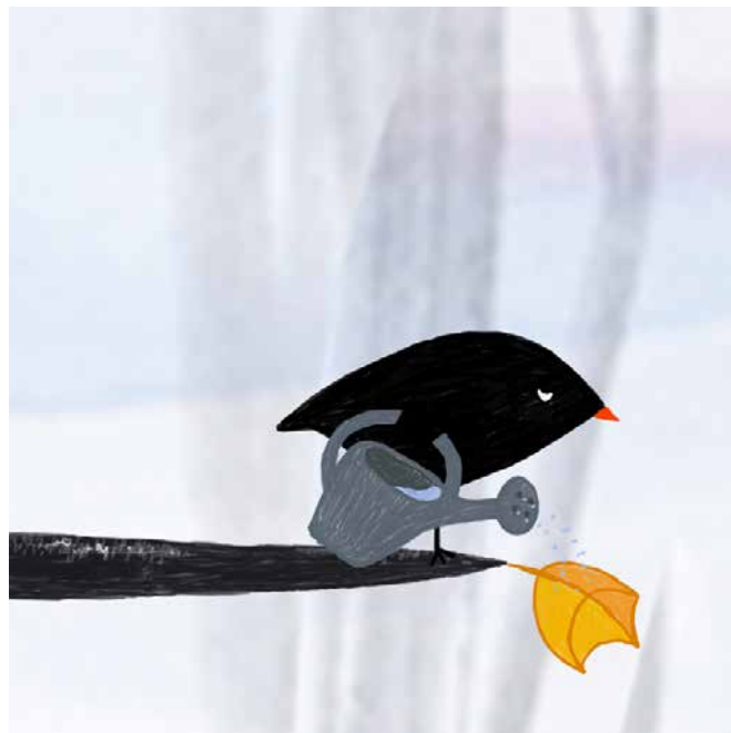
Ptičica in list

V drugem delu bosta predavatelja predstavila praktično izvedbo pogovorov z otroki in odraslimi ob ogledu izbranih otroških animiranih filmov.